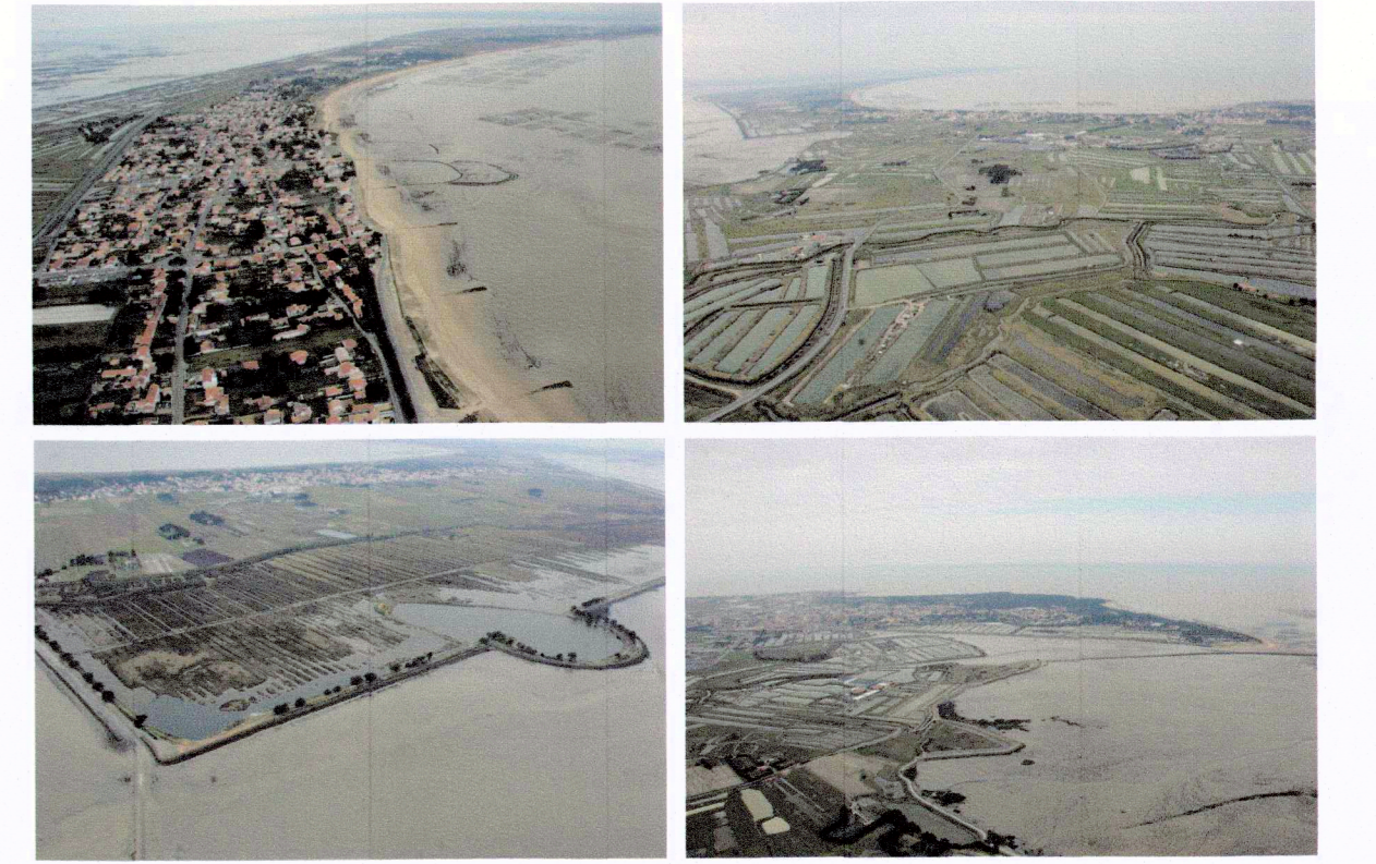
Île de Noirmoutier après le passage de Xynthia