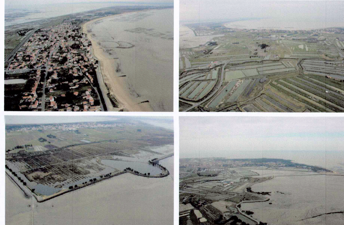
Île de Noirmoutier après le passage de Xynthia